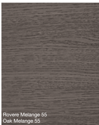
Rovere Melange 55 Oak Melange 55