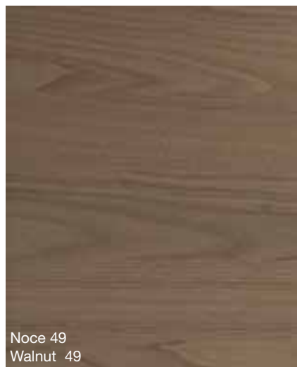
Noce 49 Walnut 49

Horizontal grain on fronts / vertical grain on panellings and structures / Horizontal grain on fronts / vertical grain on panellings and structures